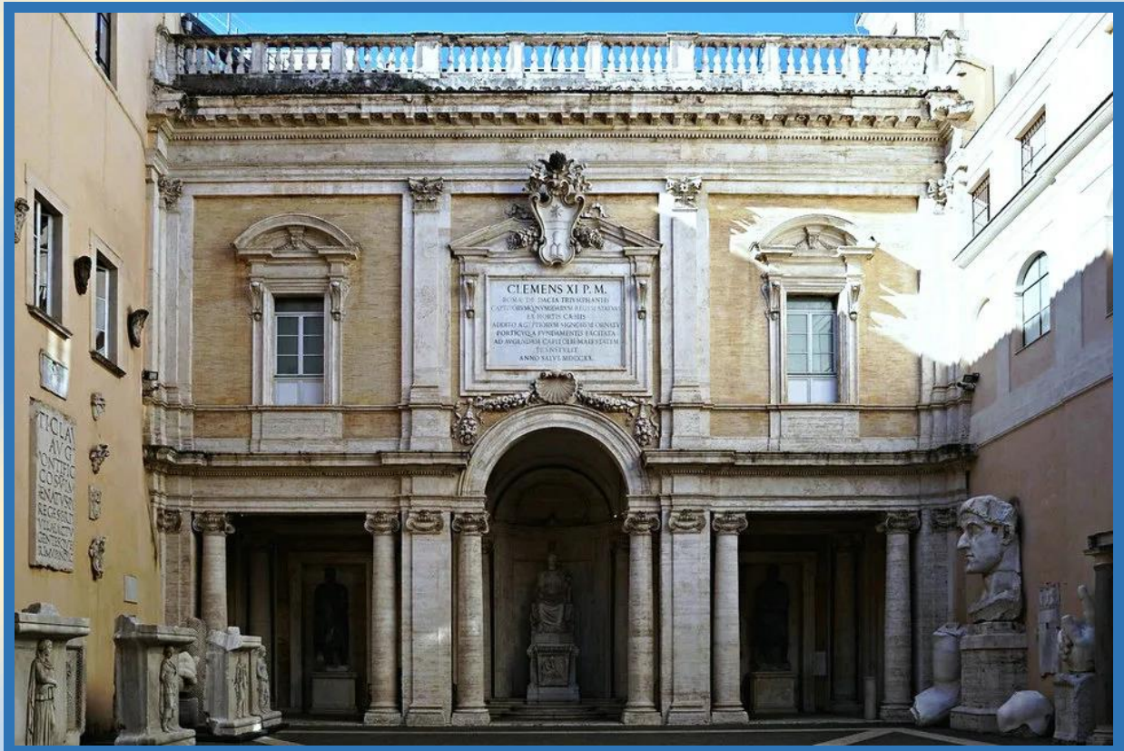
Az aláírás helyszíne

A Római Szerződés végül 1958. január 1-jén lépett életbe, majd 1965-ben módosították. 1965 után még hét alkalommal módosítottak a szerződésen, valamint csatlakozási szerződésekkel is bővült.