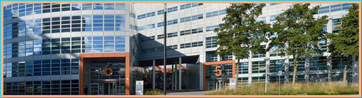
A Hágai Nemzetközi Magánjogi Konferencia épülete

Az Európai Unió úgy határozott az Európai Unióról szóló szerződésének 12. cikkelyében, hogy minden feldolgozás alatt lévő jogalkotási aktusról értesíti a nemzeti parlamenteket. A tagállamoknak joguk van kifogásolni az egyes rendelkezéseket, leginkább abban az esetben, ha az több államra vonatkozó családjogi kérdéseket érintő határozattal megy szembe. A Konferencia döntését az Unión belül csak akkor lehet kinyilatkoztatni, ha azt minden egyes tagállam elfogadta.